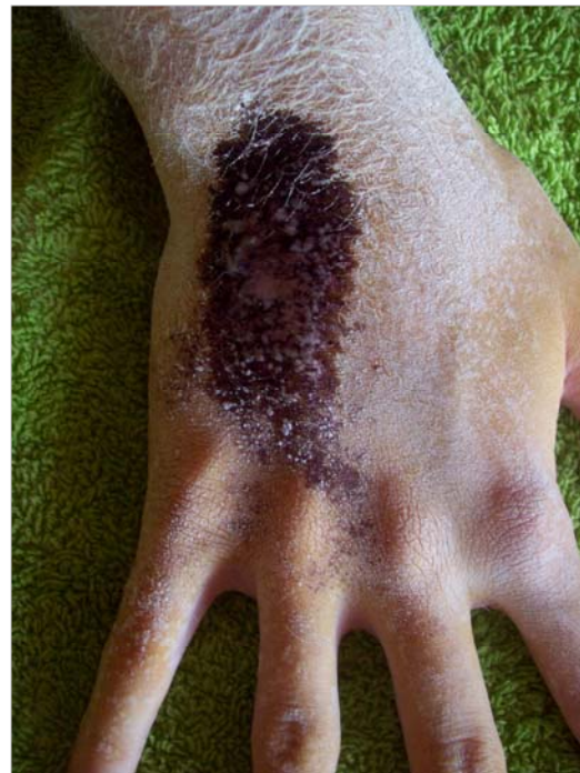
Figura 1 : El test de Minor marca una zona ovalada, circunscrita, sobre la cara volar de la mano derecha, sobre la zona inervada por el nervio cubital

Tratamiento y evolución: El tratamiento tópico con sales de aluminio resulta ineficaz. Se infiltra toxina botulínica A (2,5 U/0,1 ml/ punto de inyección, 9 puntos) desapareciendo la sudoración por completo a las 2 semanas y sin recidiva tras 11 meses de seguimiento.