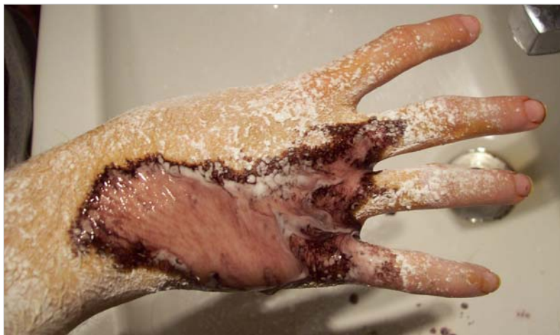
Figura 2: A los pocos segundos la intensidad de la sudoración, es muy importante y chorrea, borando el test de Minor y goteando hacia la palma y sobre el lavabo.