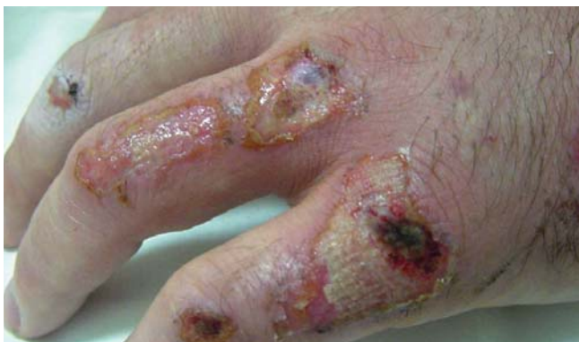
Quemadura por fricción.