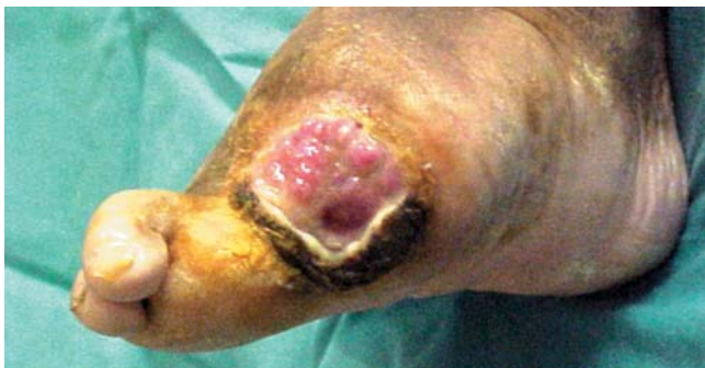
Amputación parcial en un pie de diabético.