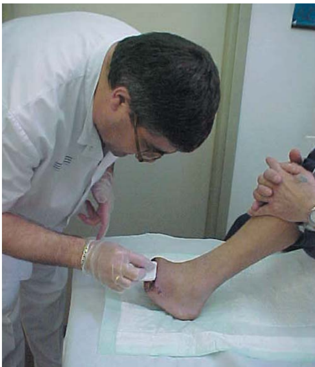
El proceso de limpieza es muy importante en el cuidado de las heridas.