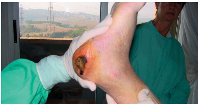
Efecto del uso continuado de antisépticos en piel perilesional.