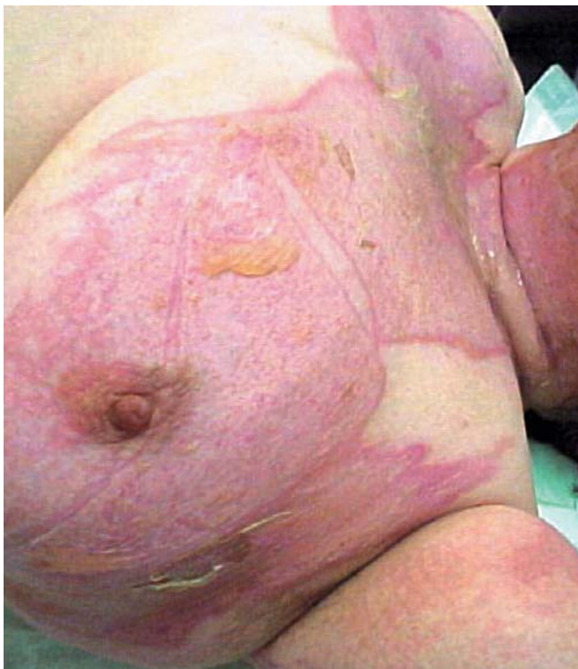
Quemadura 2° grado.

Las evidencias sugieren que se han de seleccionar antisépticos que sean activos frente a la materia orgánica y que presenten pocas contraindicaciones. El gluconato de clorhexidina al 0.05 -1 % es el antiséptico que cumple mejor estos criterios. Algunos autores han demostrado la mayor eficacia de productos con clorhexidina en la eliminación de cepas del Estafilococo Aureus Metil Resistente (MARSA) 41.