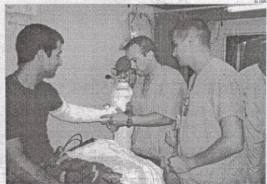
Dos profesionales de la Sanidad ejerciendo su labor.

Además, las retribuciones de los enfermeros de sanidad primaria han aumentado en un 47 por ciento y en un 57 por ciento en el caso de los enfermeros de sanidad especializada, gracias a los acuerdos alcanzados en los últimos años entre sindicatos y Administración.