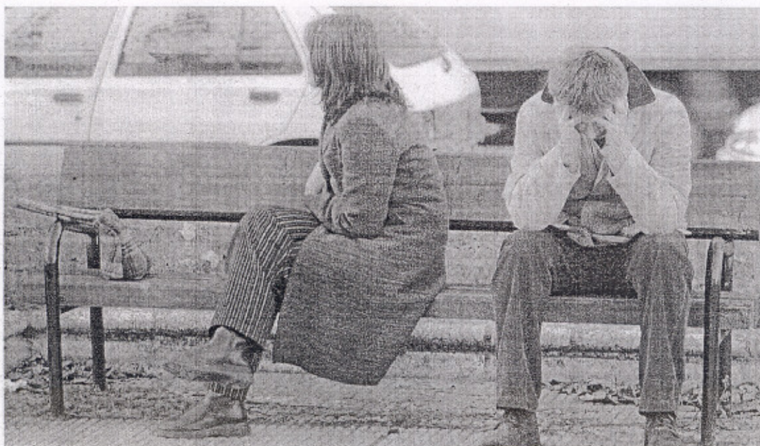
RELACIONES. Dos jóvenes, tras una discusión, permanecen sentados en un banco en el parque.