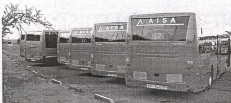
Imagen de archivo de una flota de autobuses.

La Junta convocará en los próximos días la orden de ayudas para la instalación