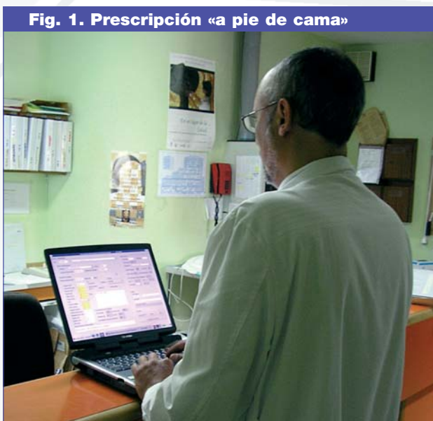
Fig. 1. Prescripción «a pie de cama»

Presentamos un proyecto pionero de prescripción informática de NP hospitalaria centralizada realizado mediante la colaboración de la sección de endocrinología y nutrición y el servicio de informática.