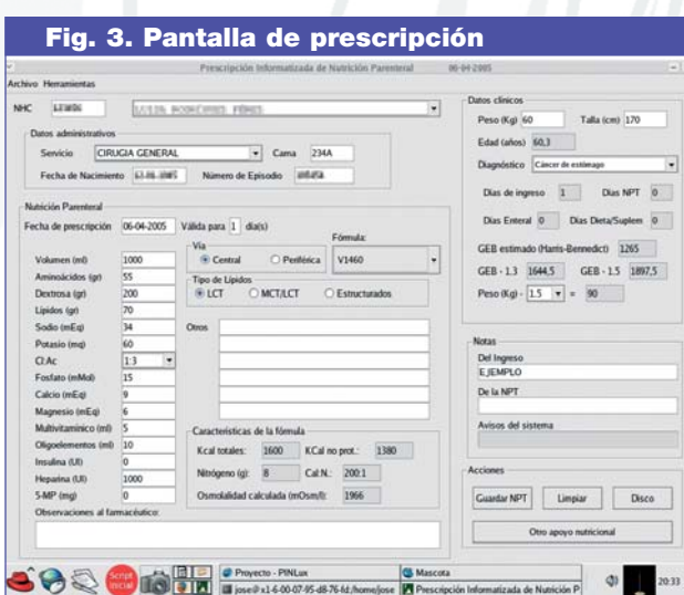
Fig. 3. Pantalla de prescripción